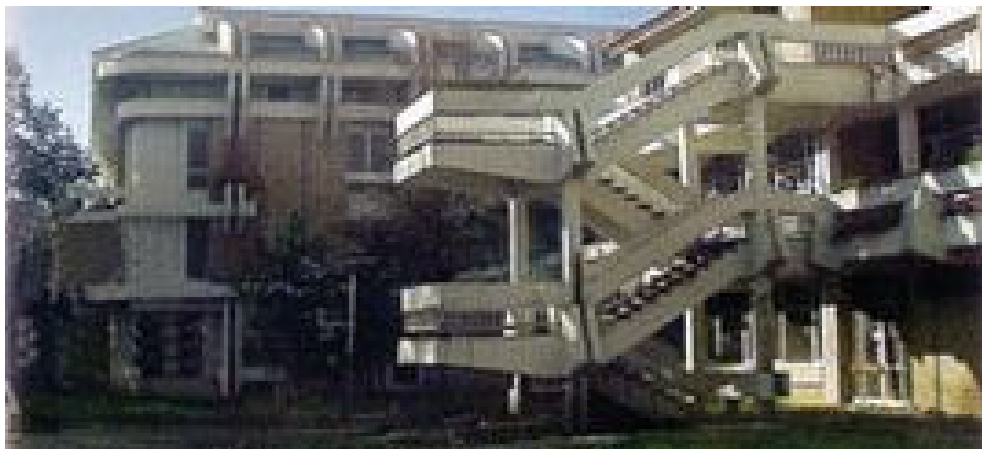
Школа општег здравља и лепоте Милутин Миланковић

Јула 2007. године отворена је обновљена родна кућа Милутина Миланковића у Даљу. Идеја је да она постане спомен-центар. Сарадња на обнови куће означава и симболично враћање дуга Србије и Хрватске Миланковићу.