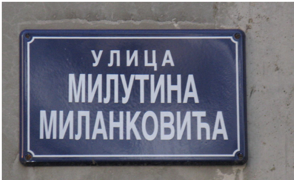
Табла са улицом Милутина Миланковића

Поводом стогодишњице рођења постављена је спомен плоча на кући број 9 у улици Љубе Стојановића у Београду коју је саградио Милутин Миланковић и у којој је проживео последње три деценије свога живота.